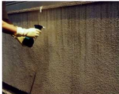
窓枠シリコンシール汚れ