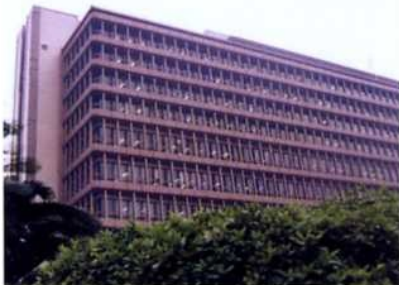
大阪高等裁判所 全景