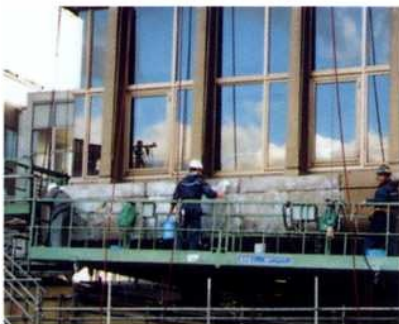
大阪高等裁判所をガードクリンで汚れ除去